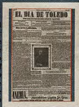
Recuerdo del primer aniversario de la muerte de Navarro Ledesma en El Día de Toledo (22 de septiembre de 1906)