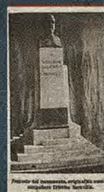
Monumento proyectado por Cristino Soravilla publicado en Toledo. Revista de Arte (1 de diciembre de 1925)