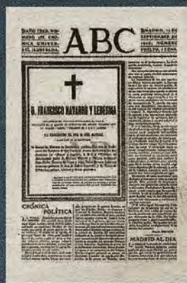
Notificación de la muerte de Navarro Ledesma en ABC (22 de septiembre de 1905)