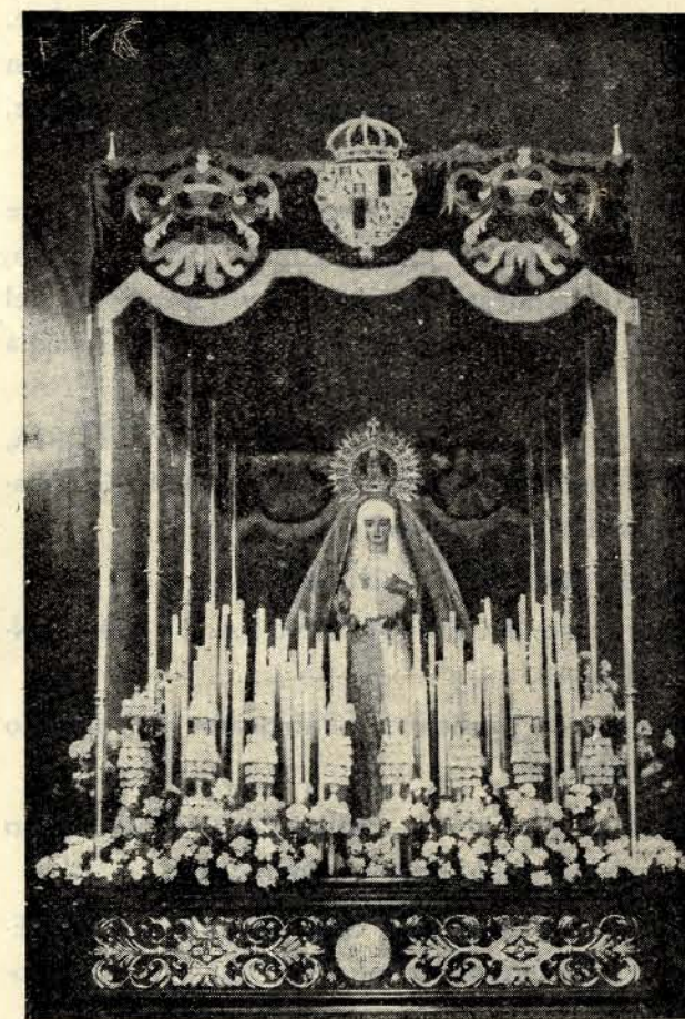
Nuestra Señora del Amparo, de la Cofradía de la Fábrica Nacional de Armas

Itinerario: Arco de Palacio, Hombre de Palo,