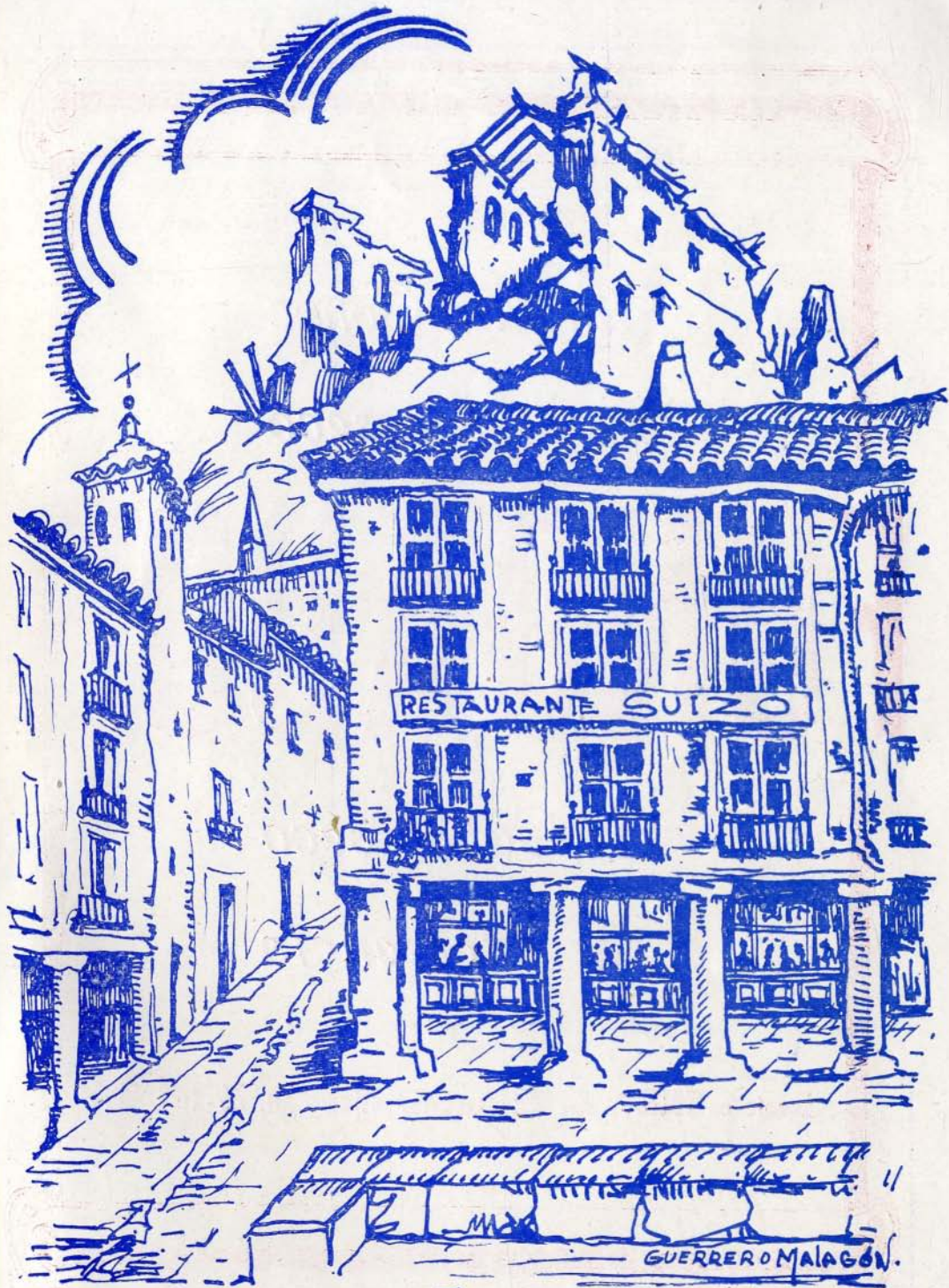
PLAZA DE ZOCODOVER-TOLEDO